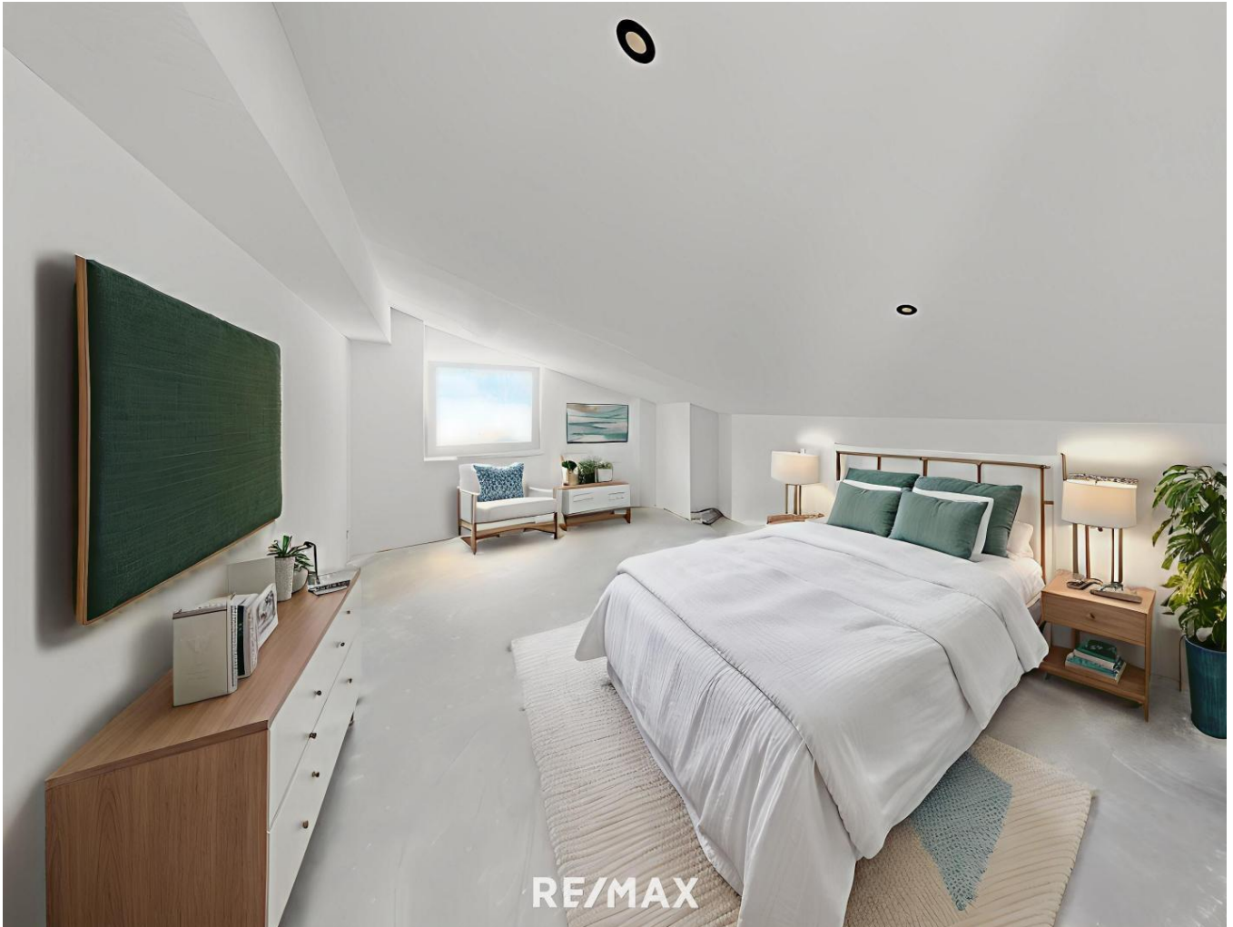
Pfunds - Visualisierung - Schlafzimmer

Objektnummer: 1613_11249 Eine Immobilie von RE/MAX Recon