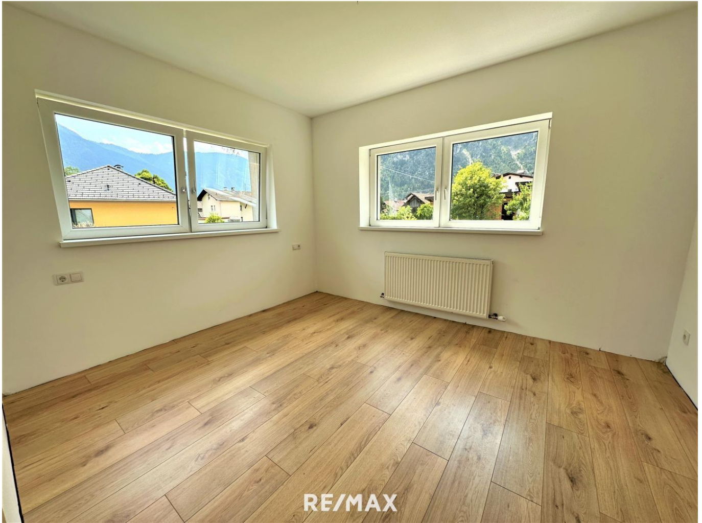
Wohnung - Wohnbereich

Objektnummer: 1613_11299 Eine Immobilie von RE/MAX Recon