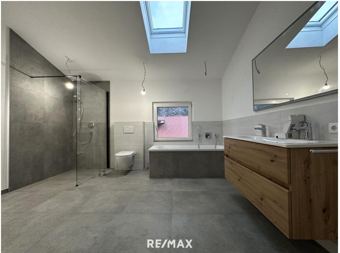
Wohnung - Bad

Objektnummer: 1613_11329 Eine Immobilie von RE/MAX Recon