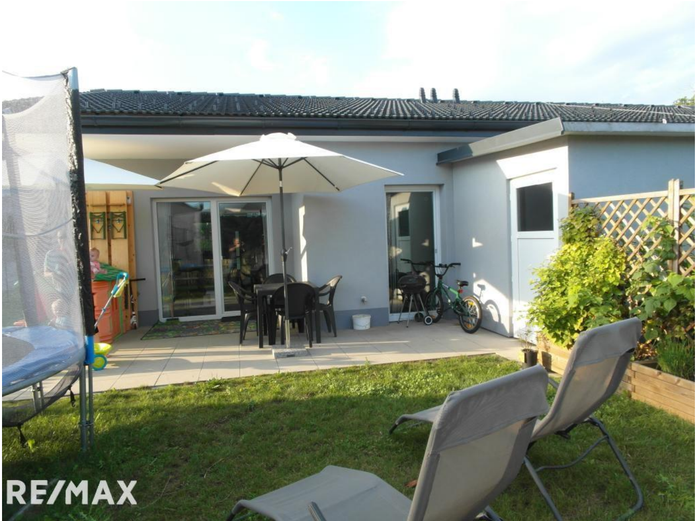
Garten mit Terrasse