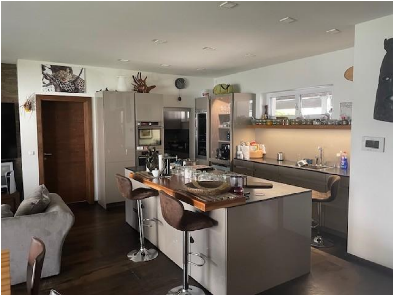
Küche Total 43