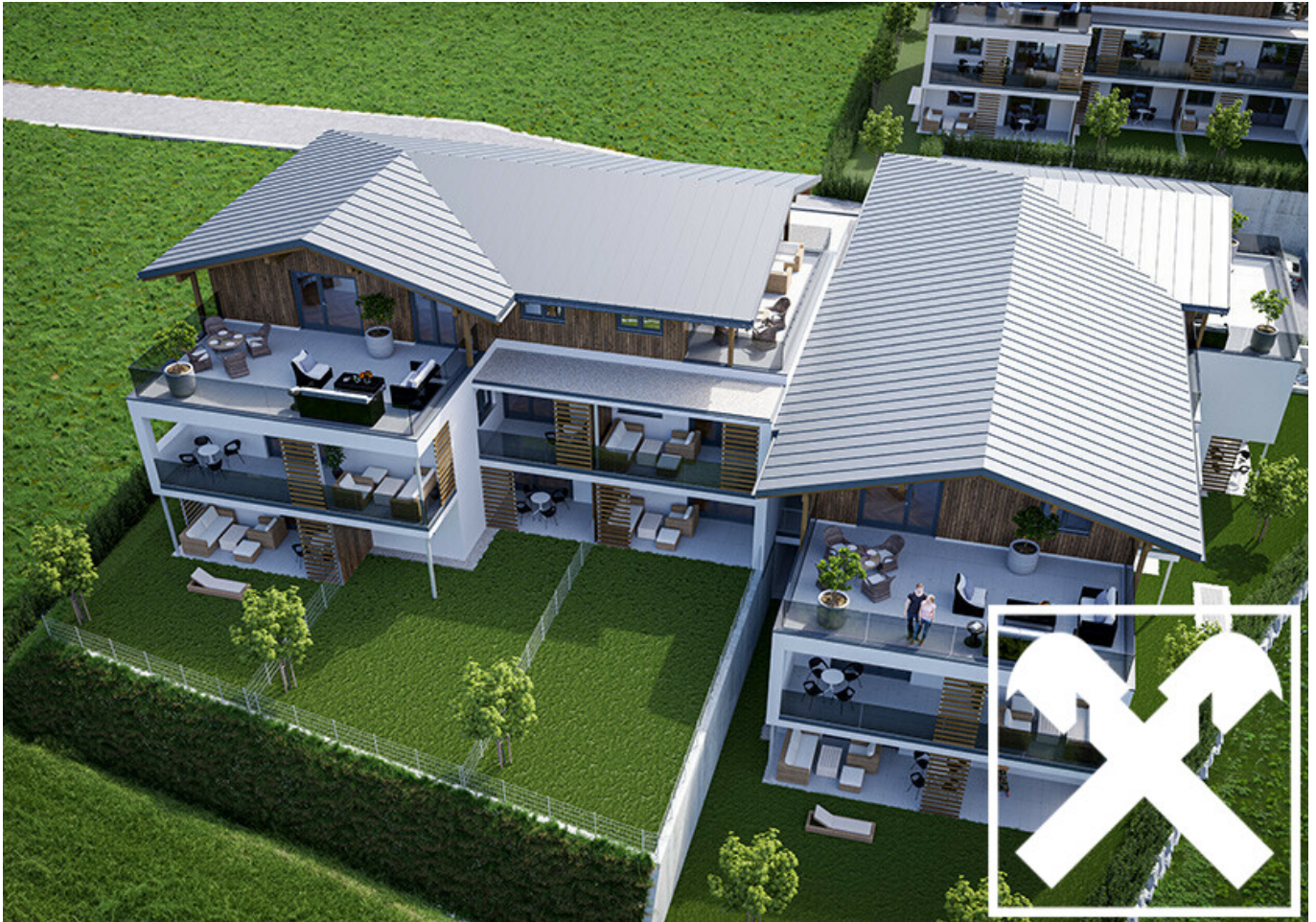
Visualisierung Haus C und D