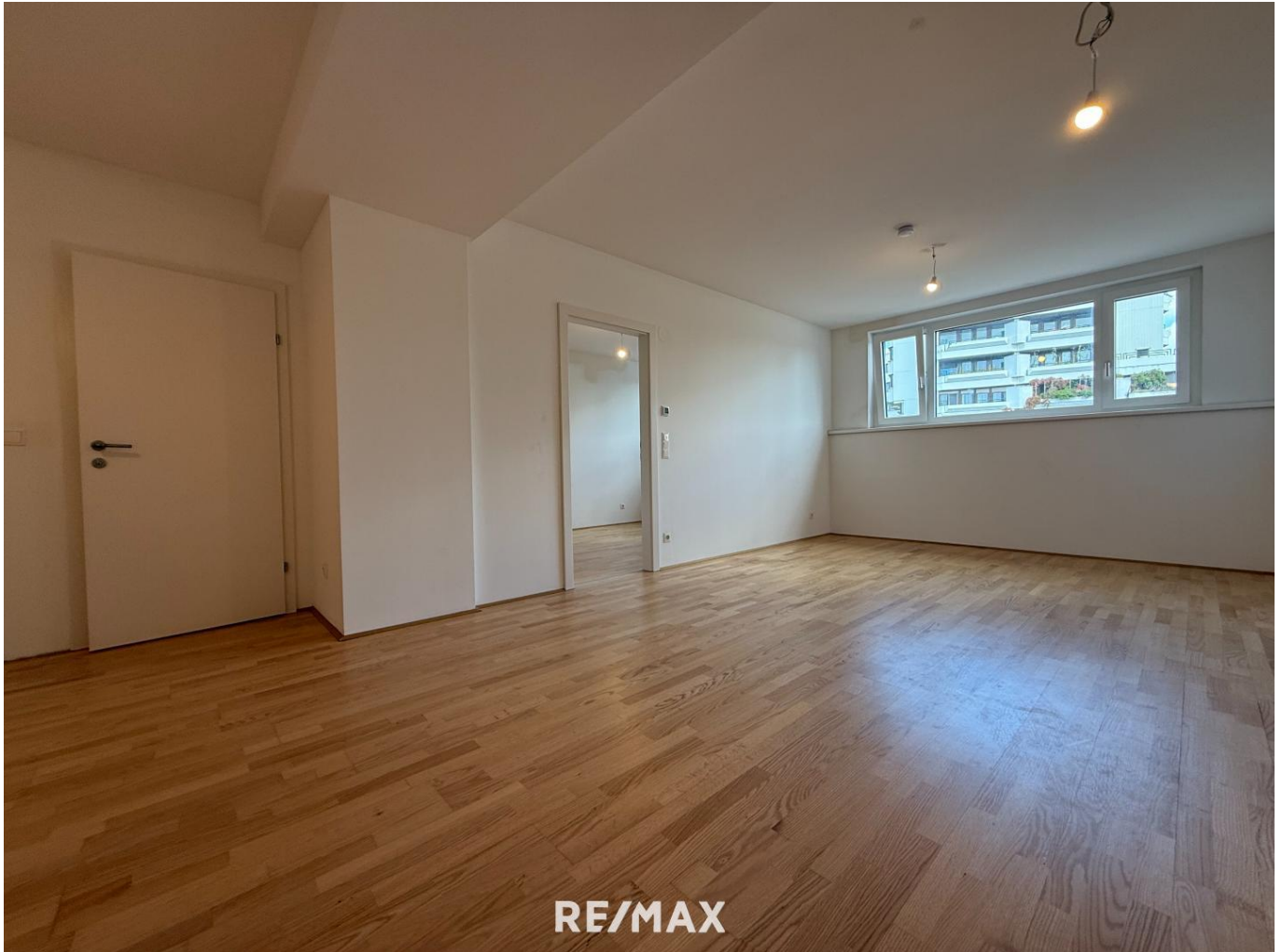
Wohnzimmer Ansicht 1