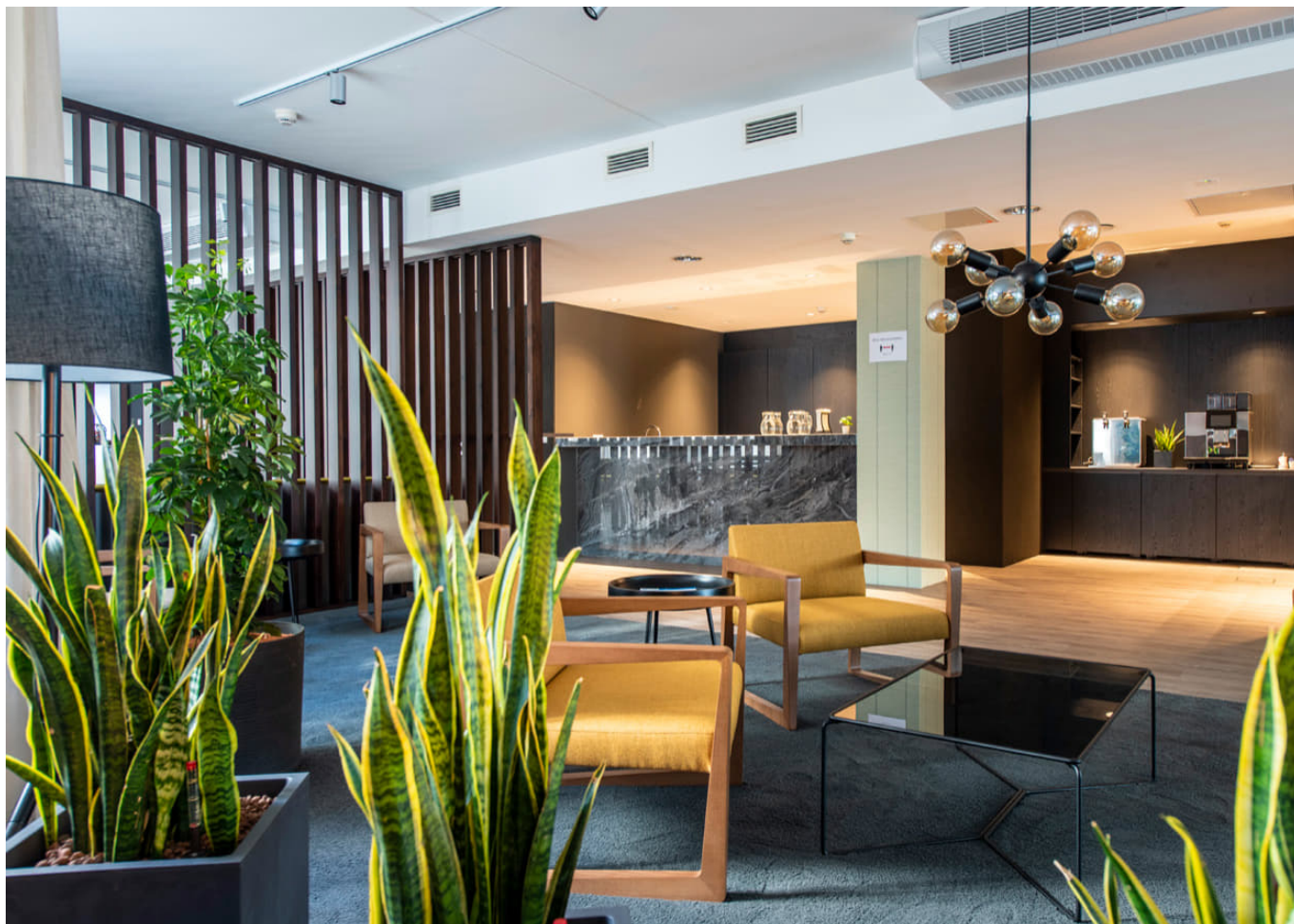
Lounge Conference Center