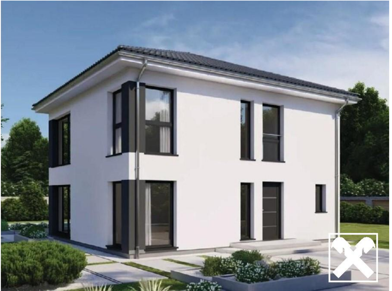
Visualisierung Haus Danwood (unverbindlich)

Jetzt werden Grundstücke wieder leistbar!