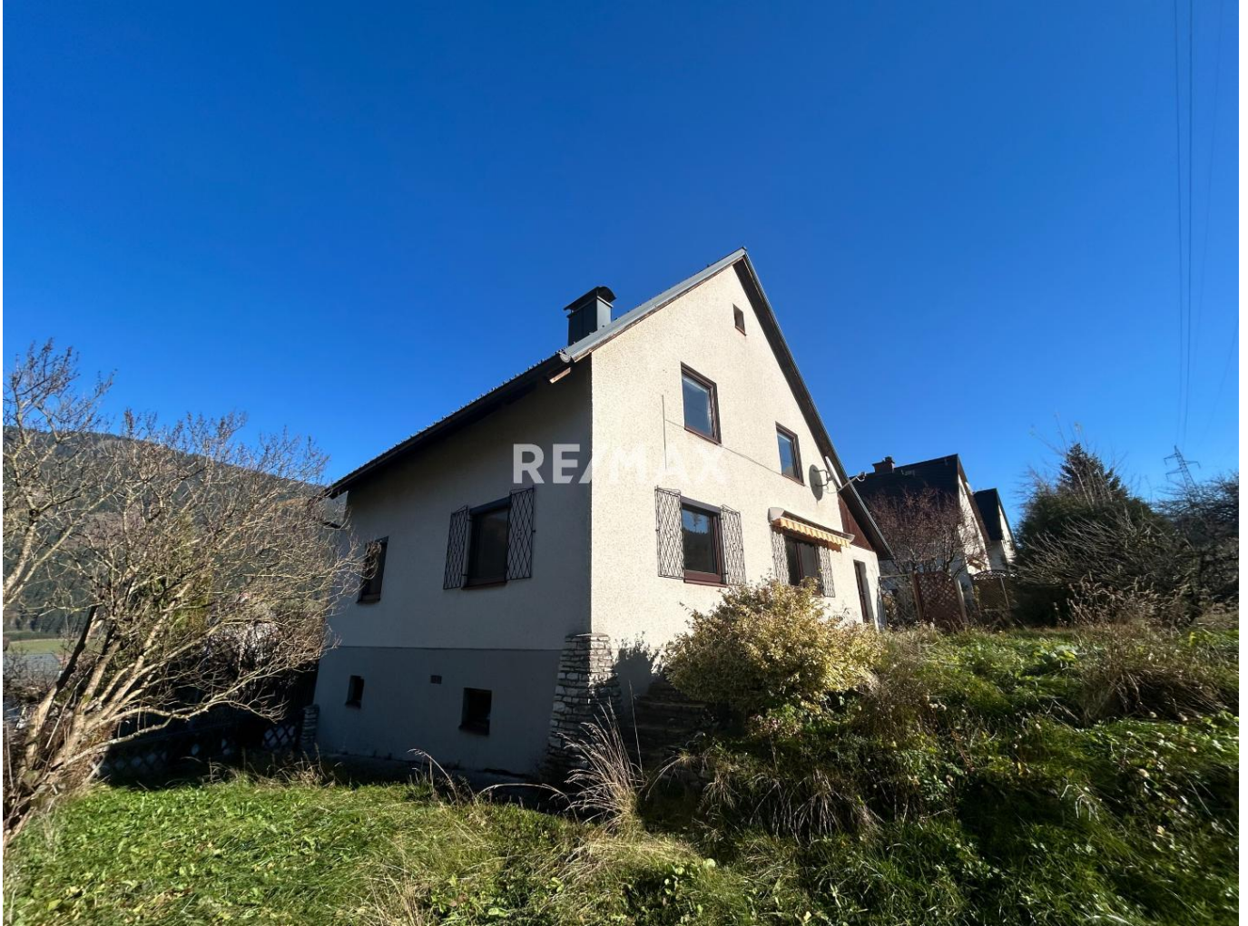
Das Haus von aussen