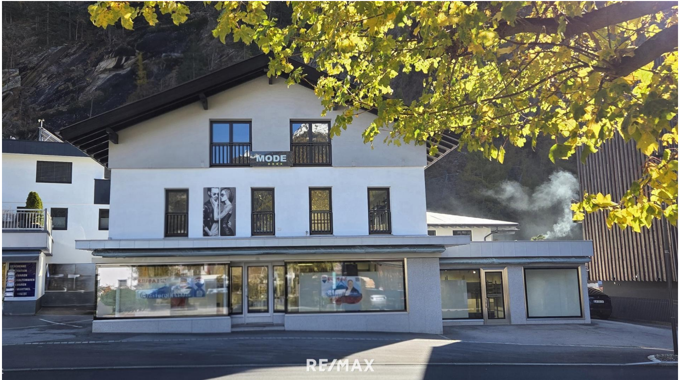
Haus - Außenansicht

Objektnummer: 1613_11331 Eine Immobilie von RE/MAX Recon