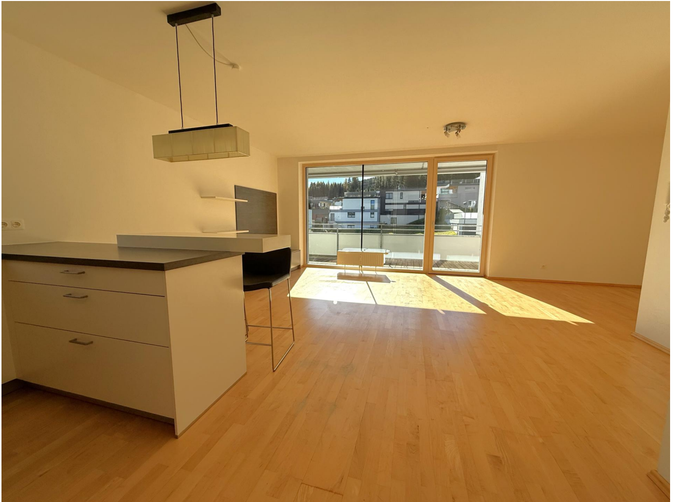
Wohnzimmer / Essbereich