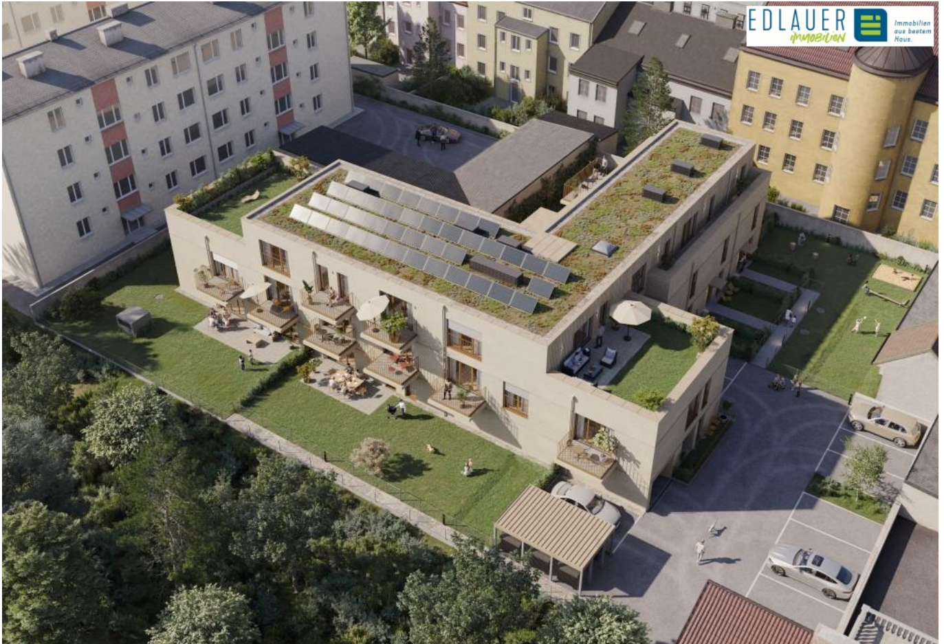
Rendering Luft (2)