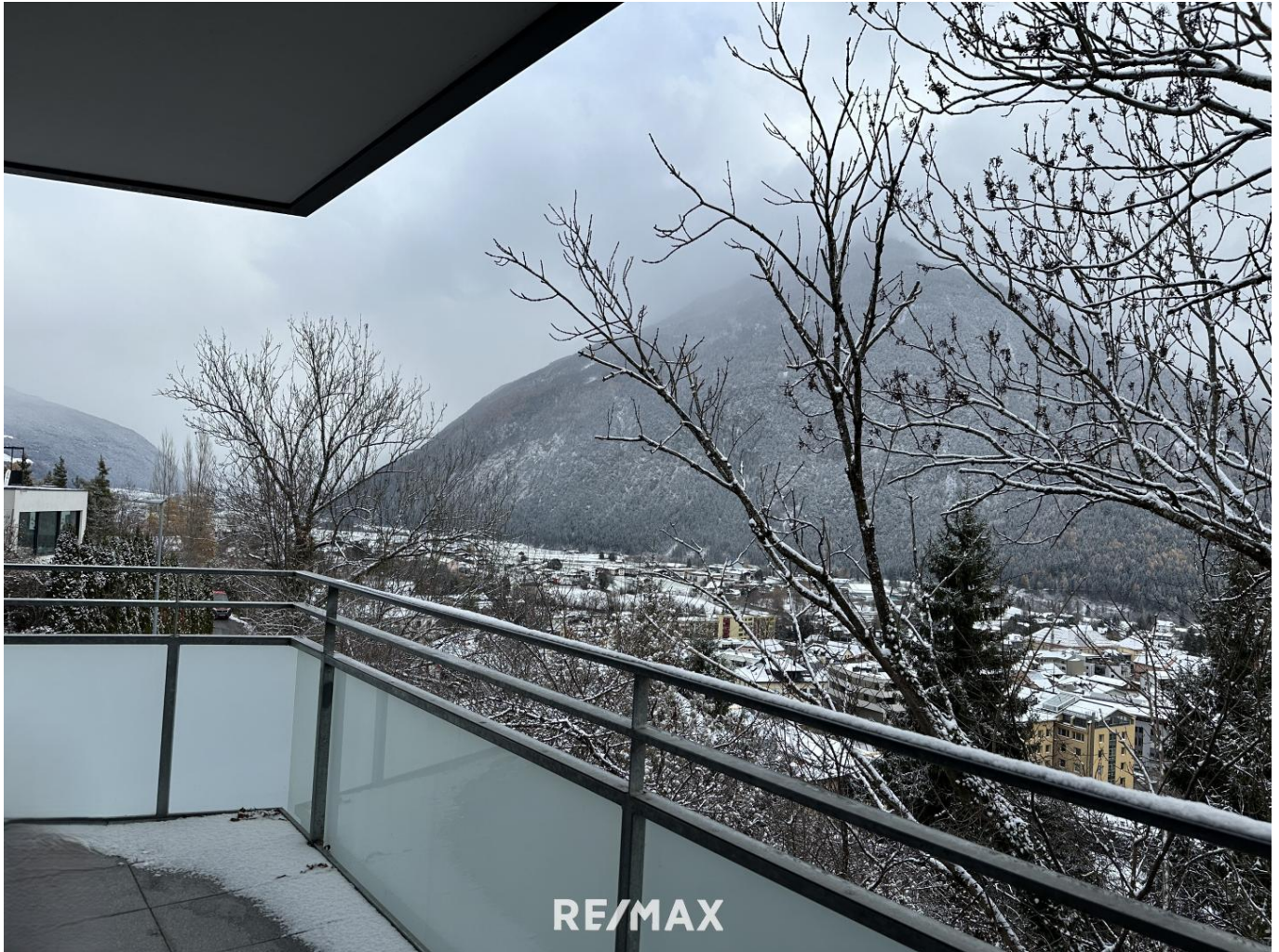
Wohnung - Aussicht