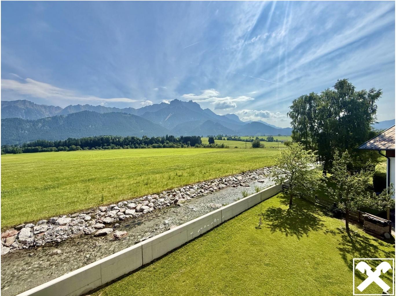
Ausblick Balkon I