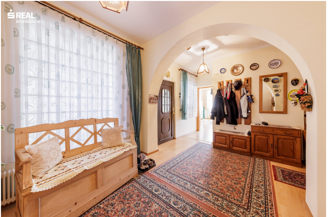
Eingangsbereich 1 EG