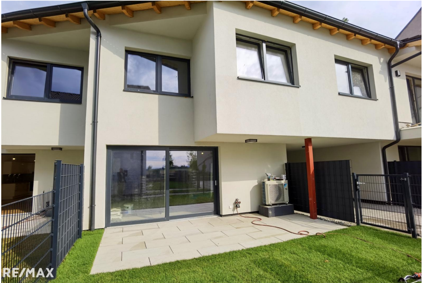
Gartenansicht Haus 2