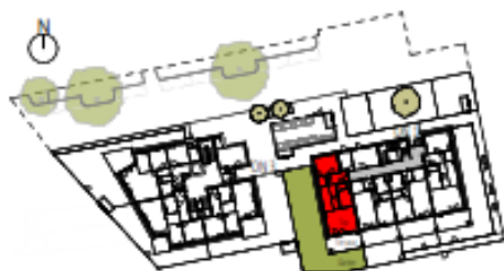
Übersicht Erdgeschoss M=1 : 1250