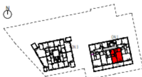
Übersicht 2. Obergeschoss M=1 : 1250