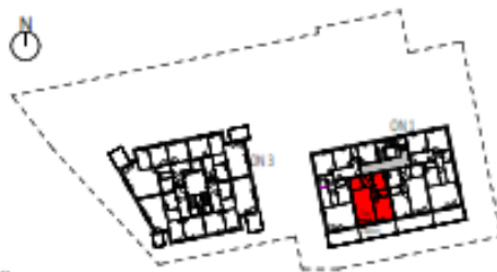
Übersicht 2. Obergeschoss M=1 : 1250