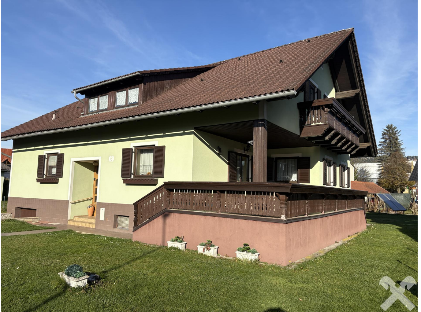
Wohnhaus mit Terrasse