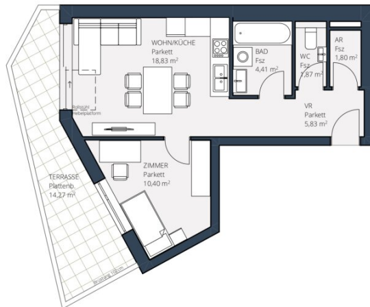
TOP 9 - 1. DG