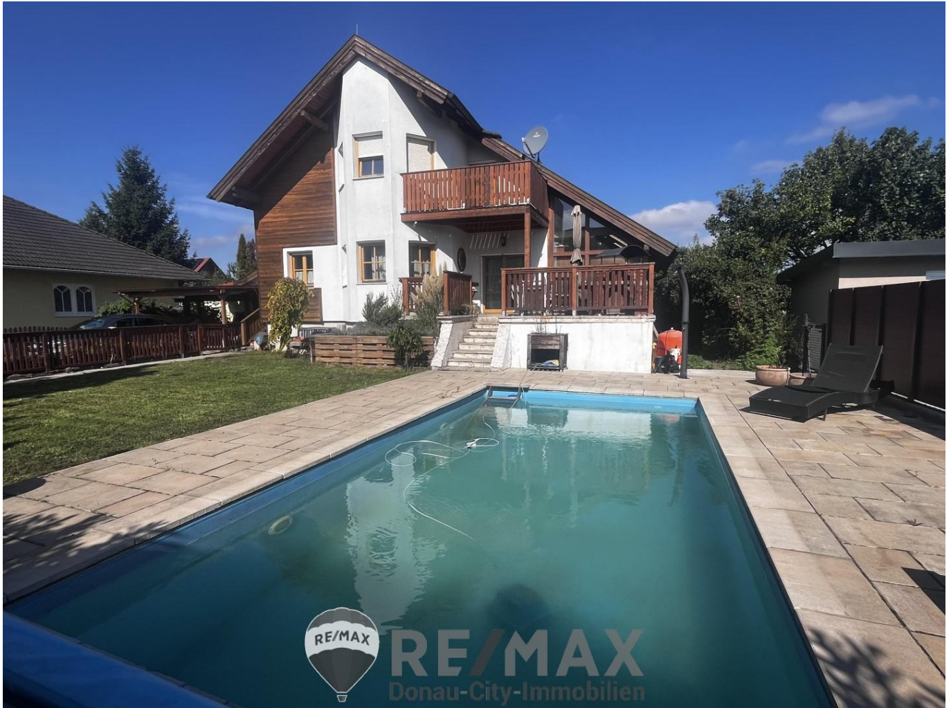
01 Einfamilienhaus in Steinabrückl