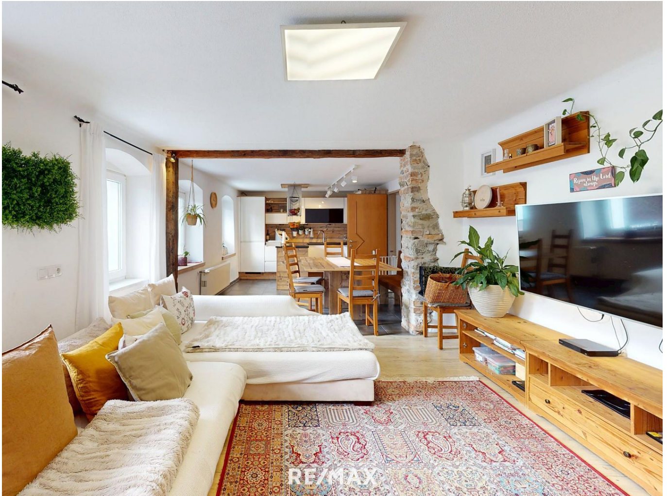
Wohnung - Wohnbereich

Objektnummer: 1613_11368 Eine Immobilie von RE/MAX Recon