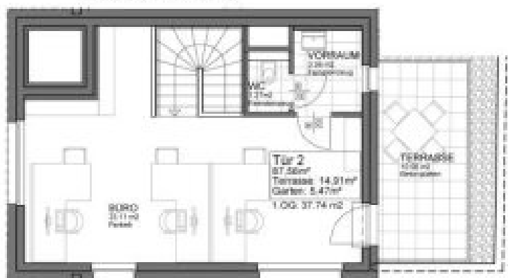
1.STOCK, TÜR 2