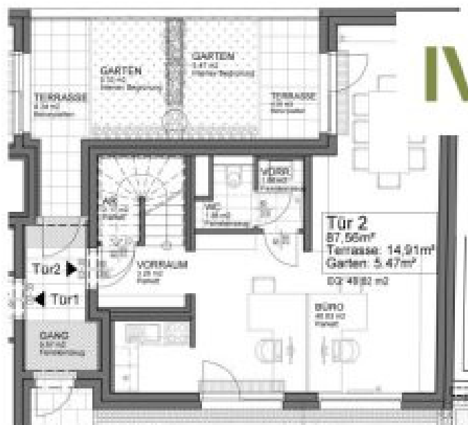
ERDGESCHOSS, TÜR 2