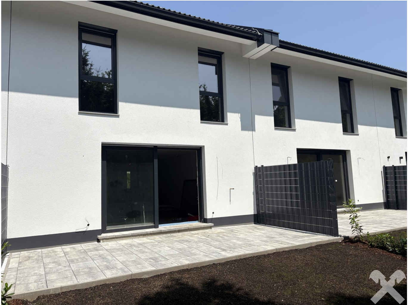
Südansicht mit Garten und Terrasse