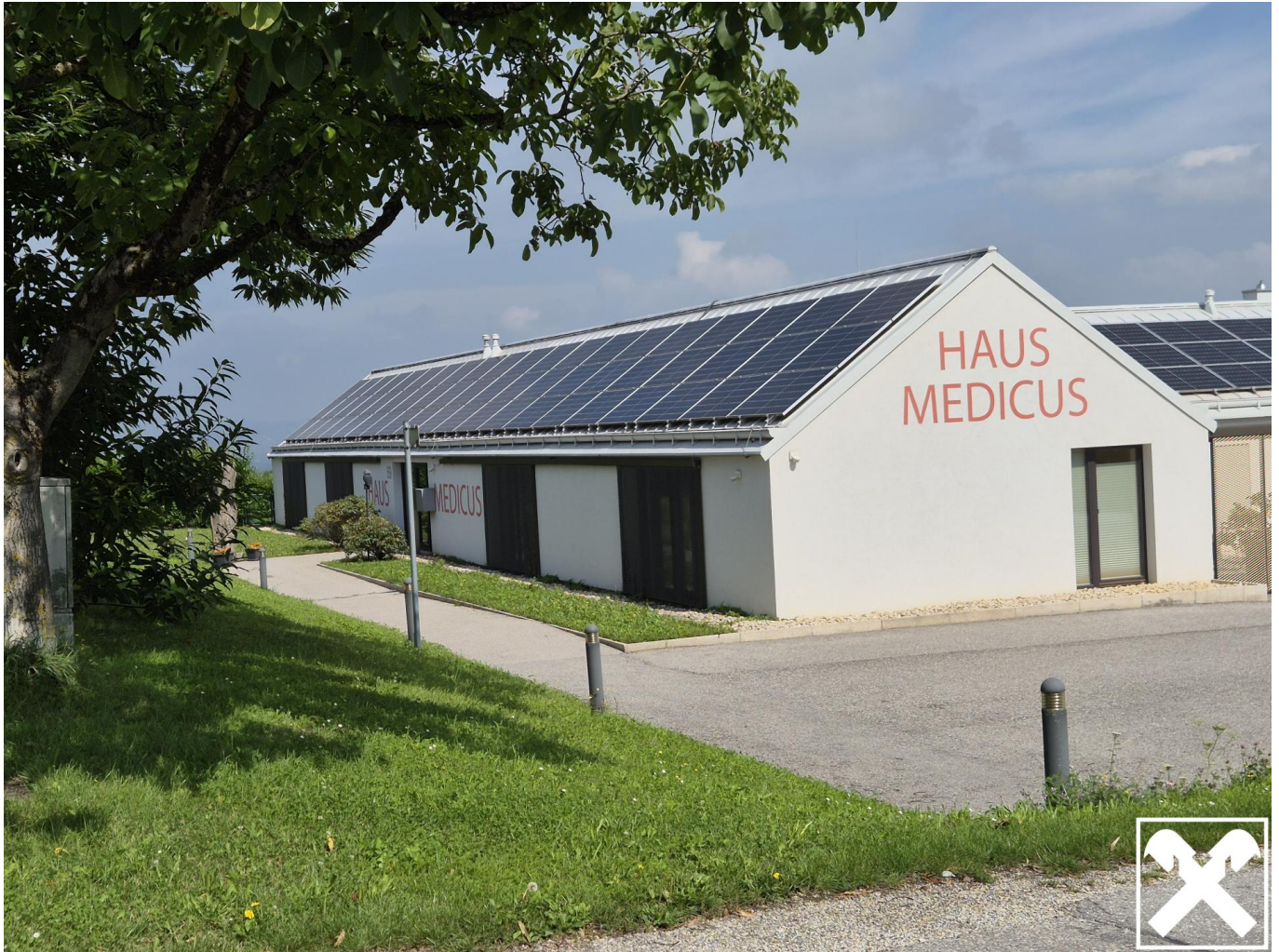
Haus Medicus Außenansicht Reith 4073 Wilhering (2)