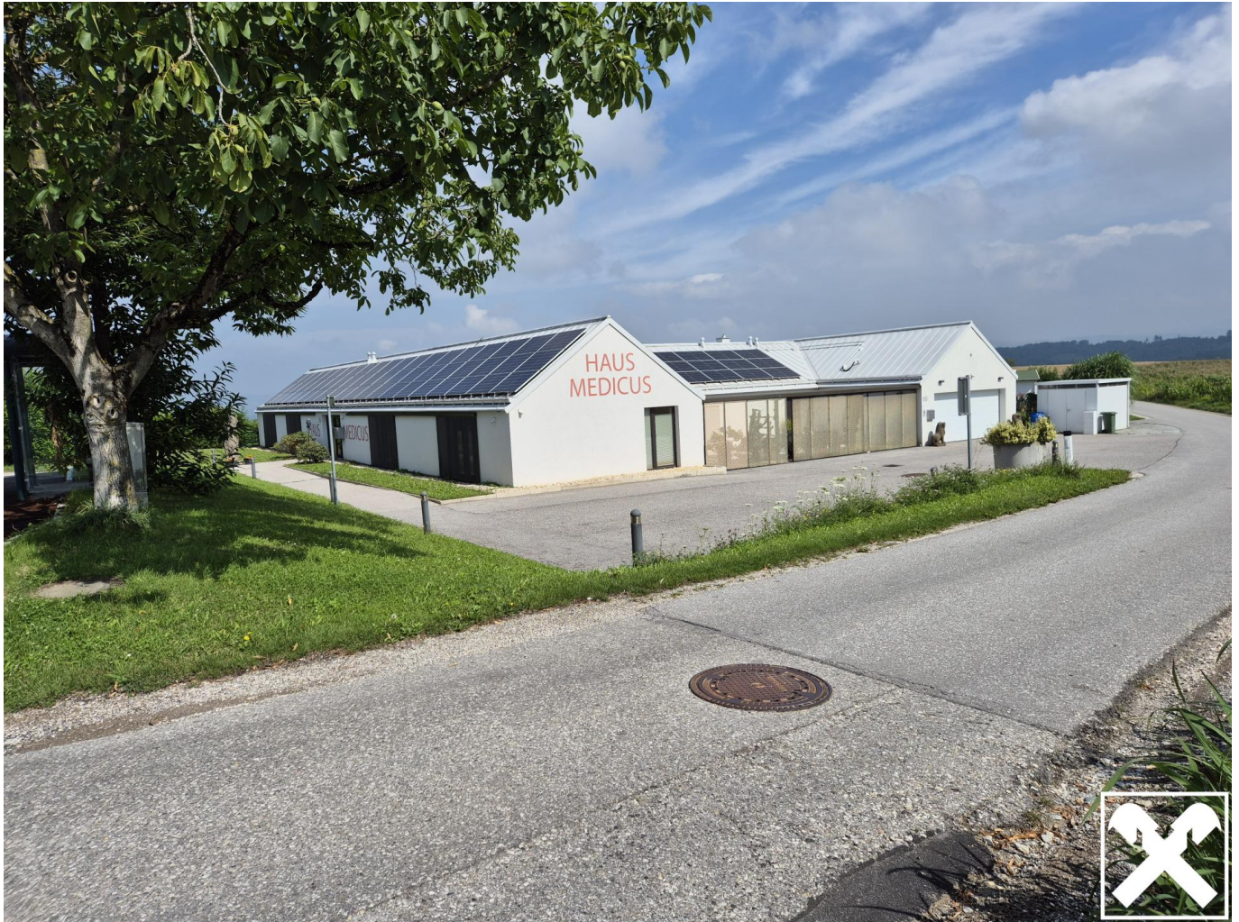
Haus Medicus Außenansicht Reith 4073 Wilhering (1)