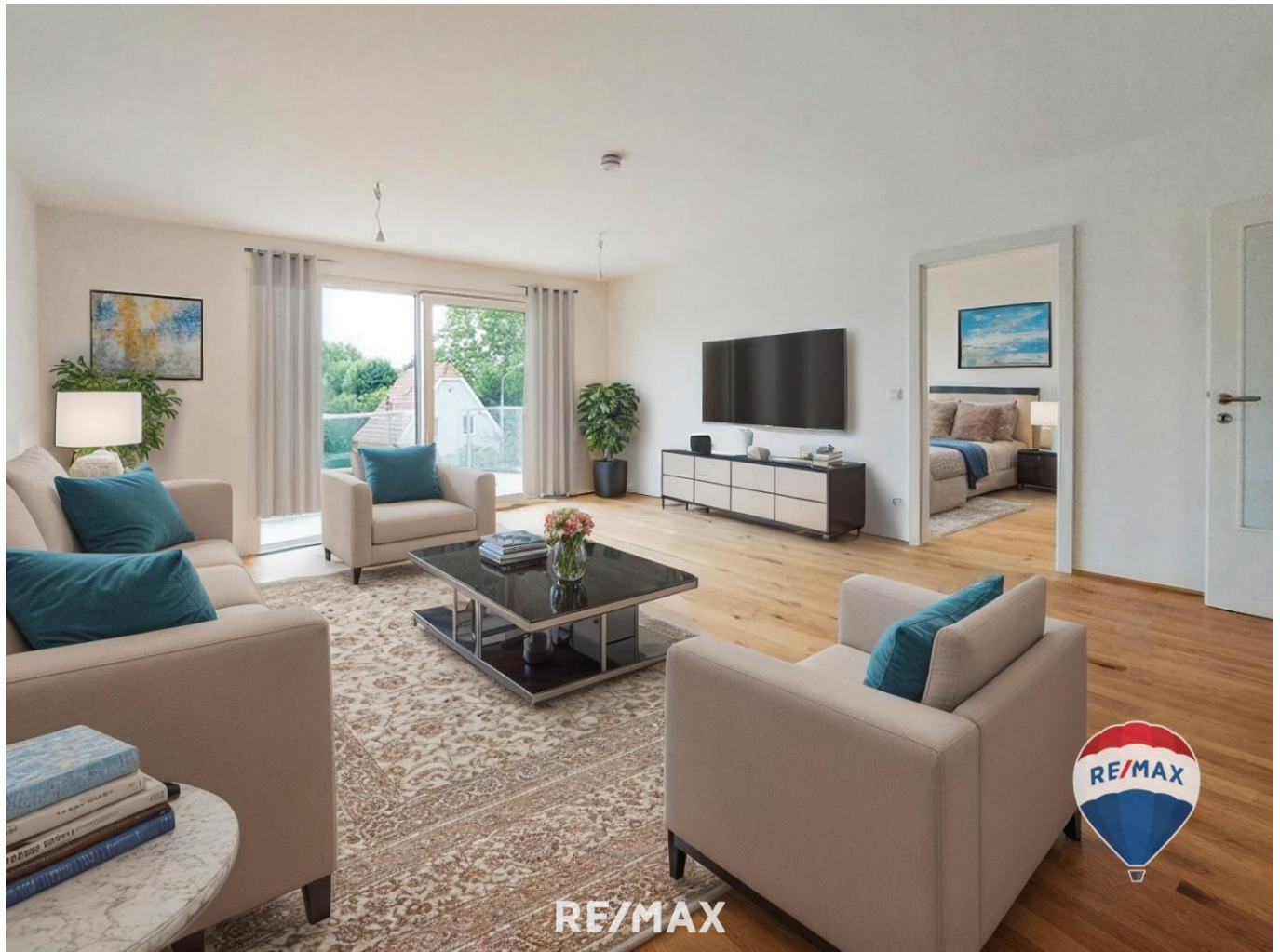
Wohnküche (virtuelles Staging)