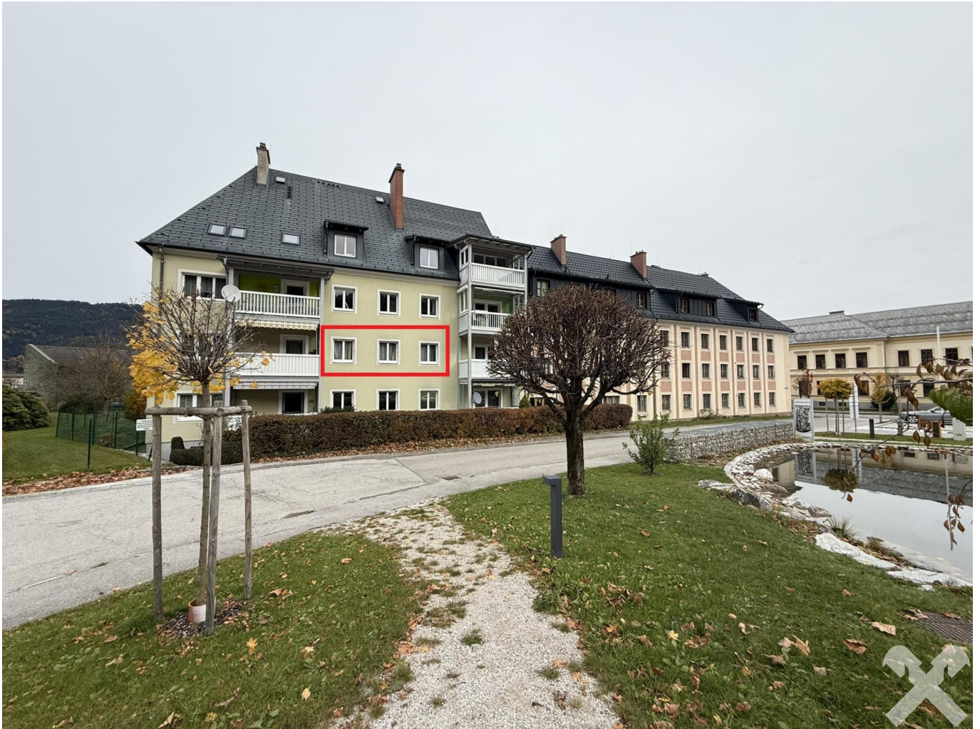
Außenansicht mit Teich