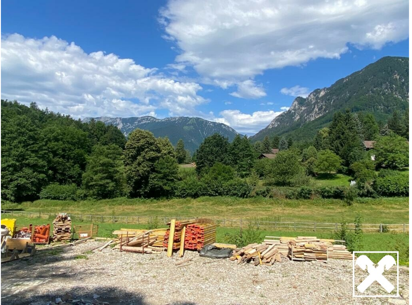
Bauplatz und Ausblick