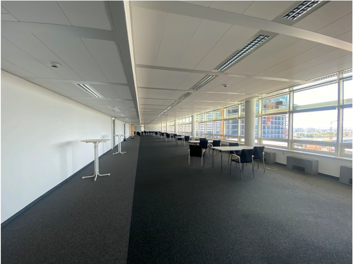
Gate 2 5OG