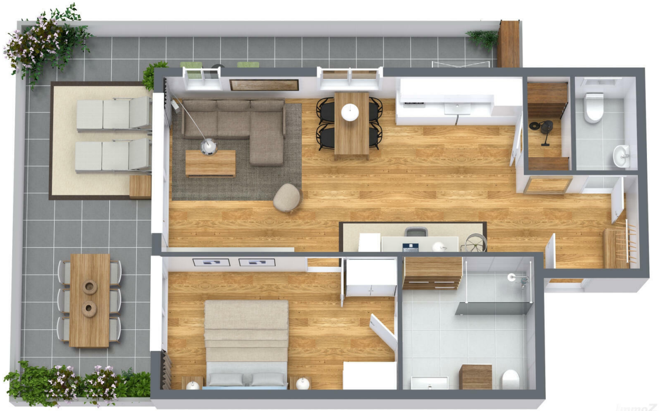
Nußbaumerstraße - 1. Etage - 3D Floor Plan