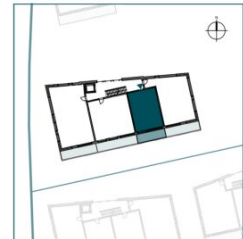
Top 10 // 2. OG // 2 Zimmer