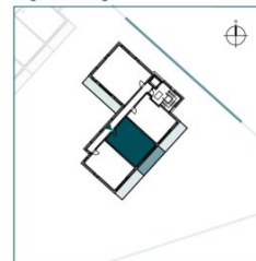
Top 10 // 2. OG // 2 Zimmer