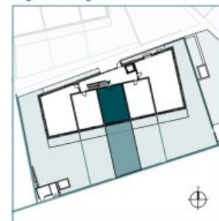
Top 3 // EG // 2 Zimmer