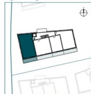
Top 8 // 1. OG // 4 Zimmer