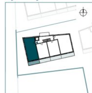
Top 7 // 1. OG // 3 Zimmer