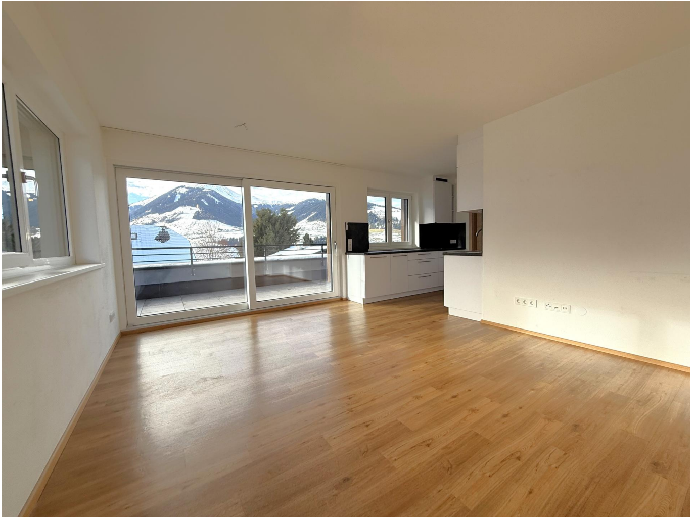
Wohnbereich und Küche