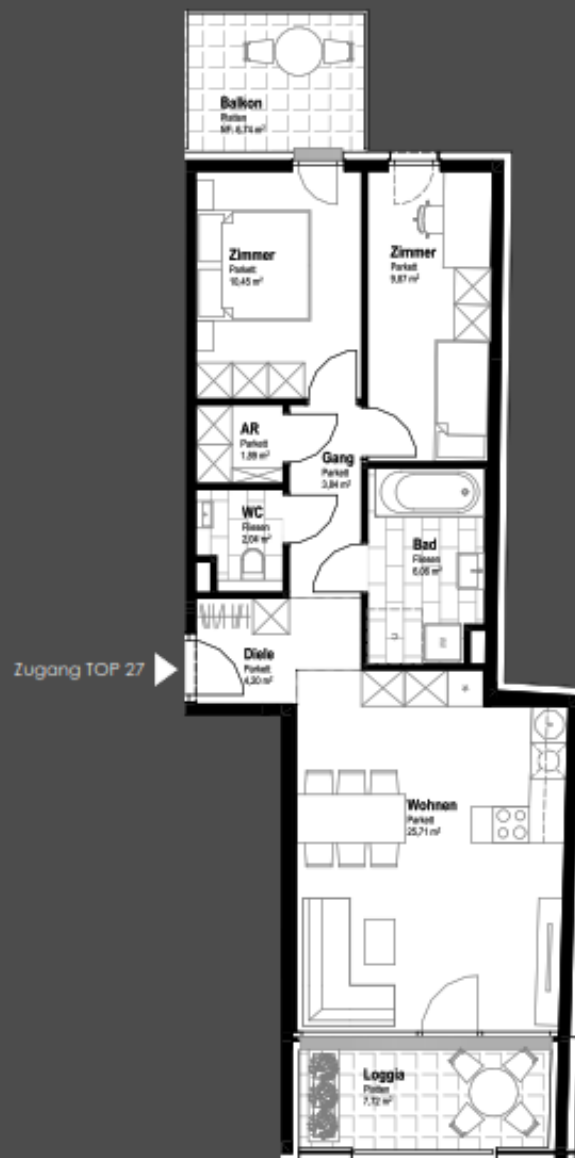
TOP 27 / 2. OBERGESCHOSS