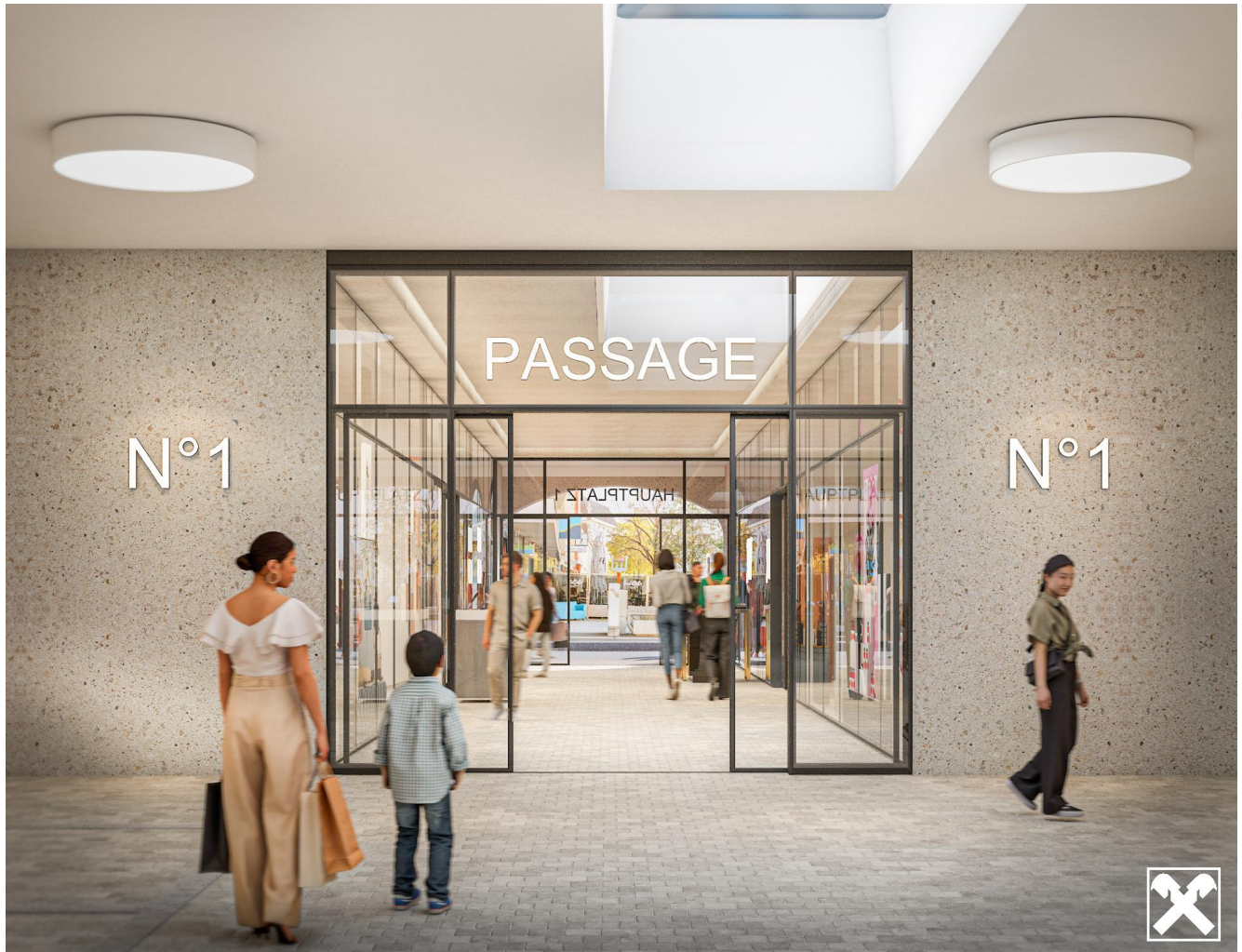
Bauwerk Hauptplatz 1 Schwechat Passage