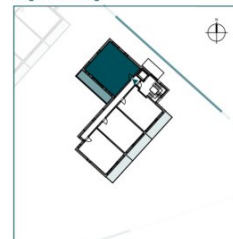
Top 8 // 1. OG // 3 Zimmer