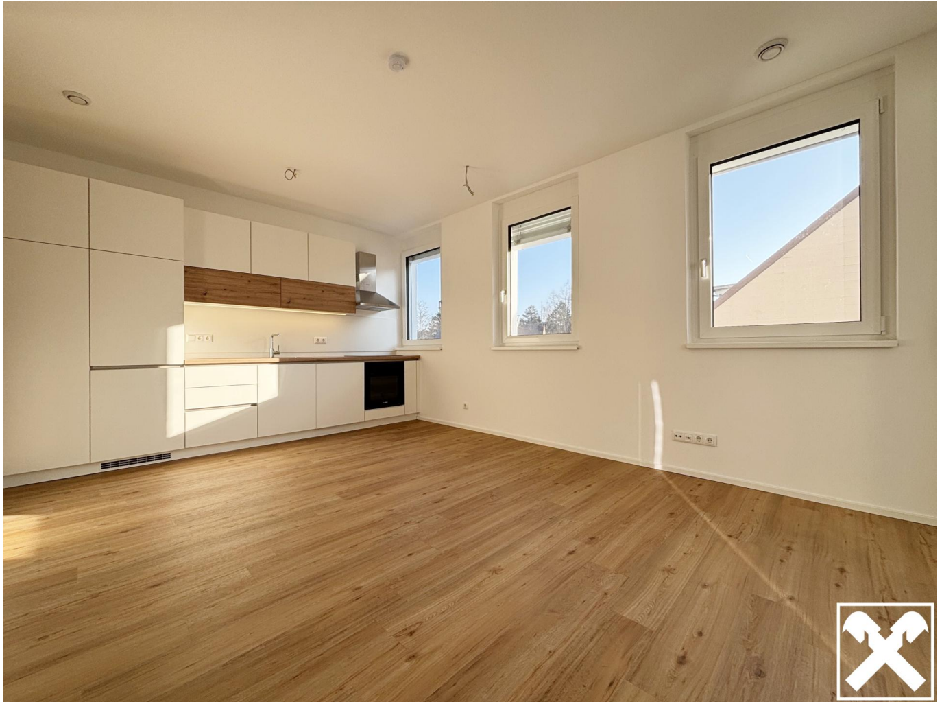
Wohn & Essbereich