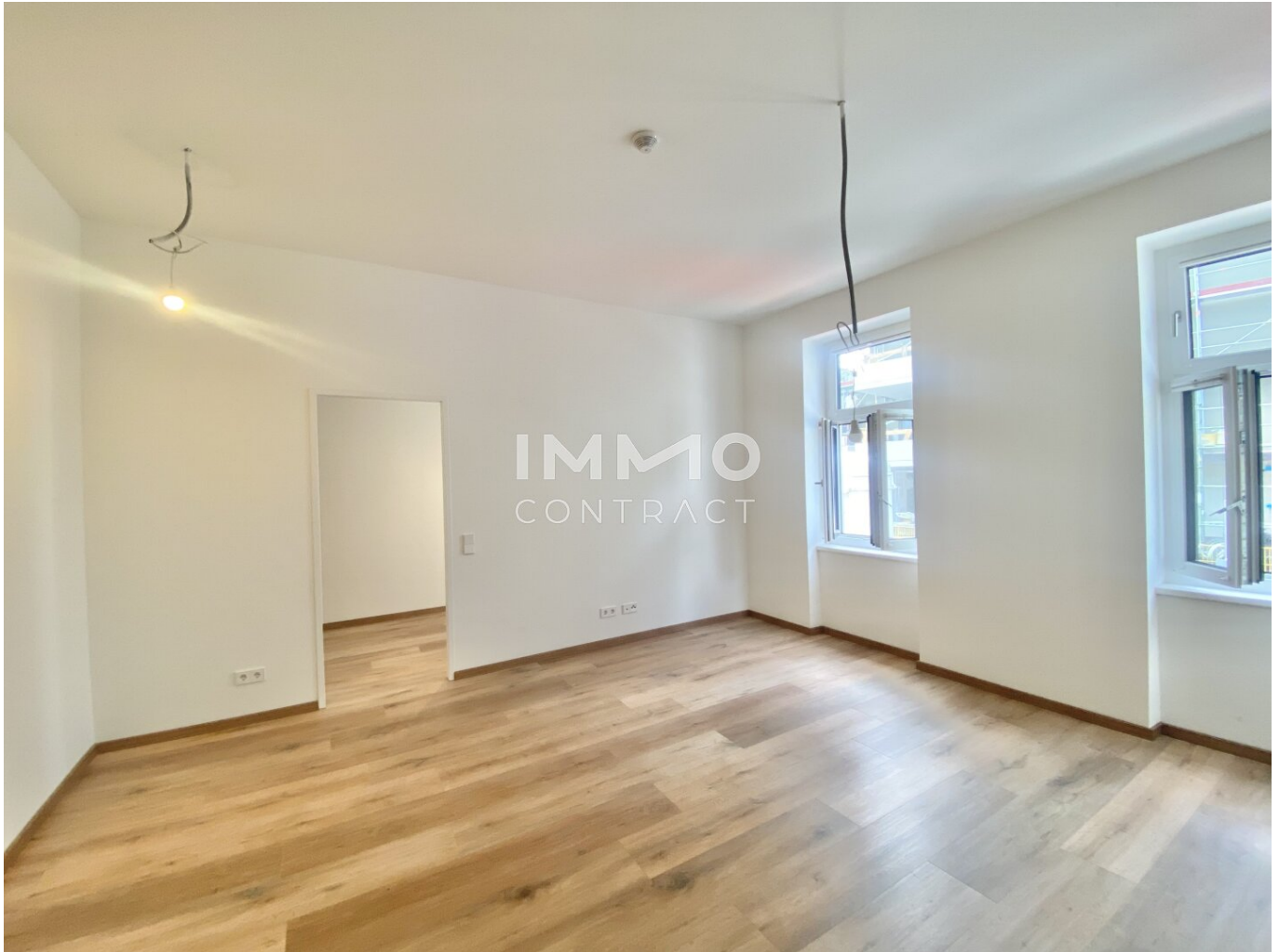
Wohnesszimmer oder Schlafzimmer 3