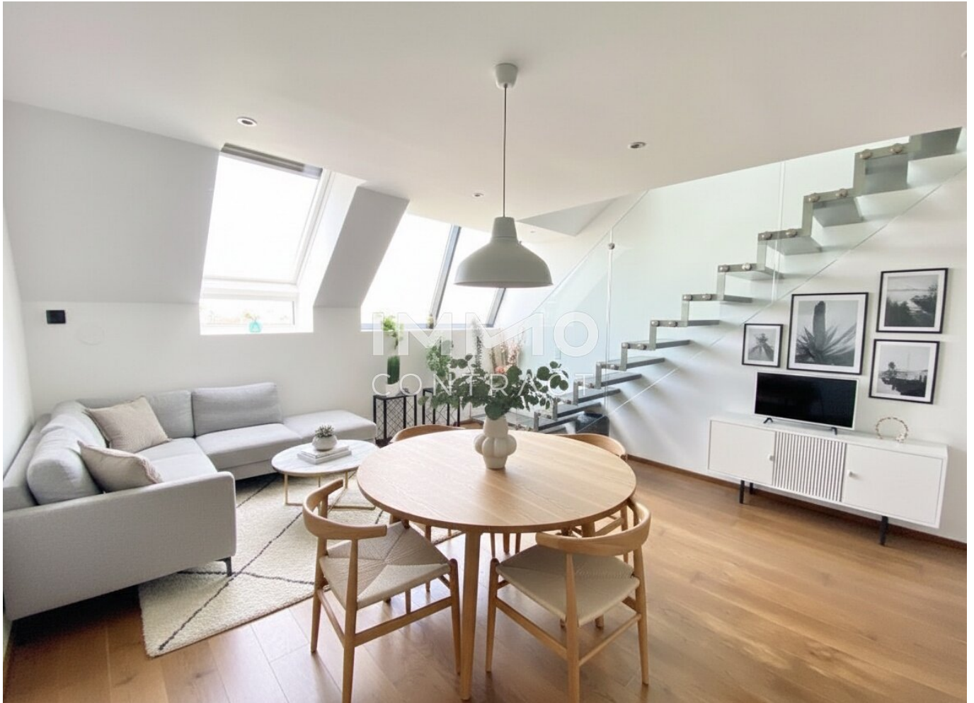
Wohnzimmer KI möbliert