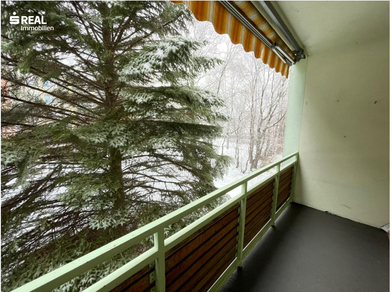
Loggia Perspektive 1