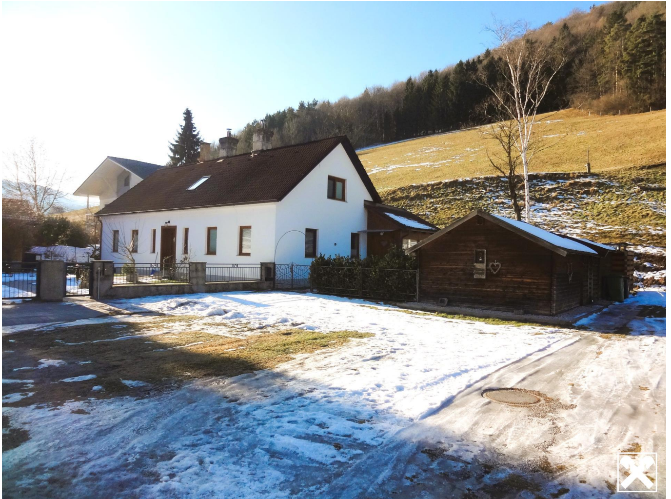
Ansicht Haus, Hütte