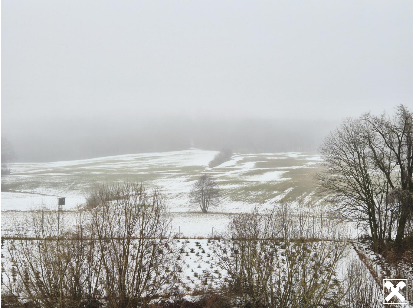
Ansicht I Acker & Wiese