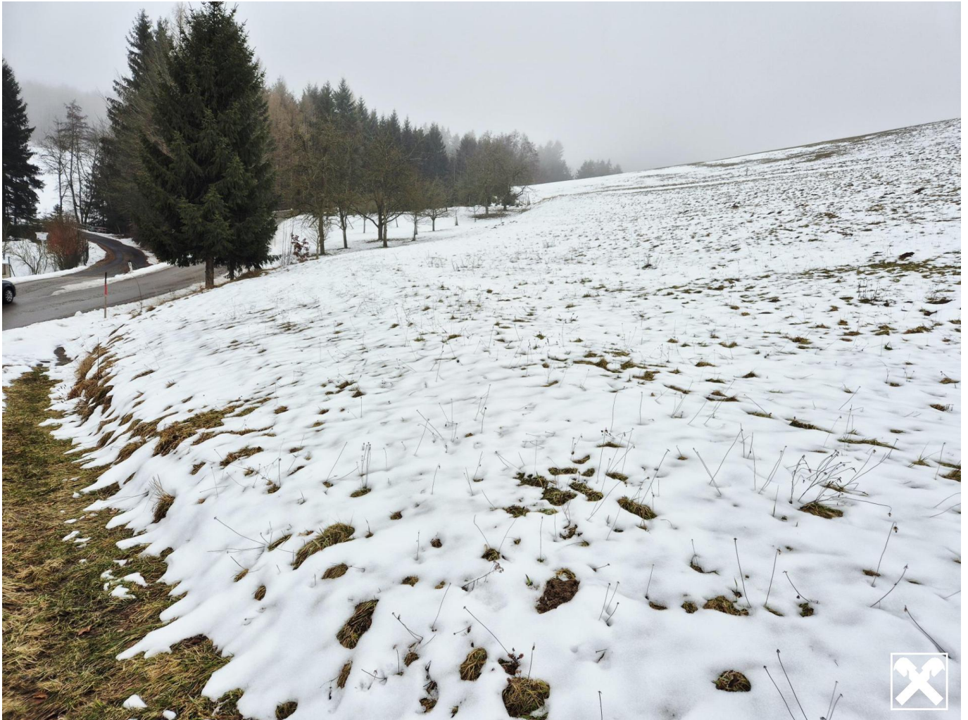
Ansicht I Nr. 4