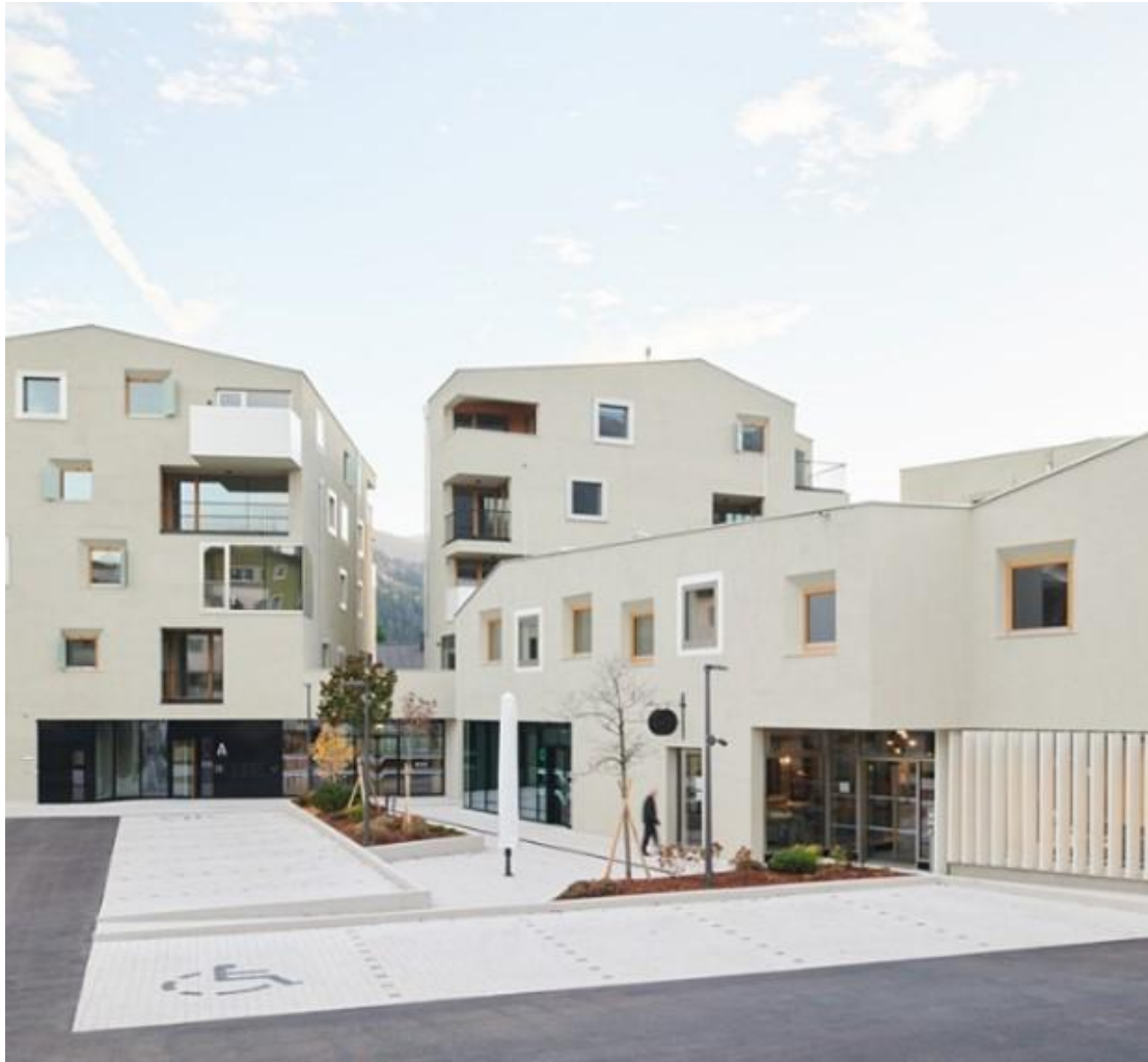
Ansicht Quartier am Raiffeisenplatz