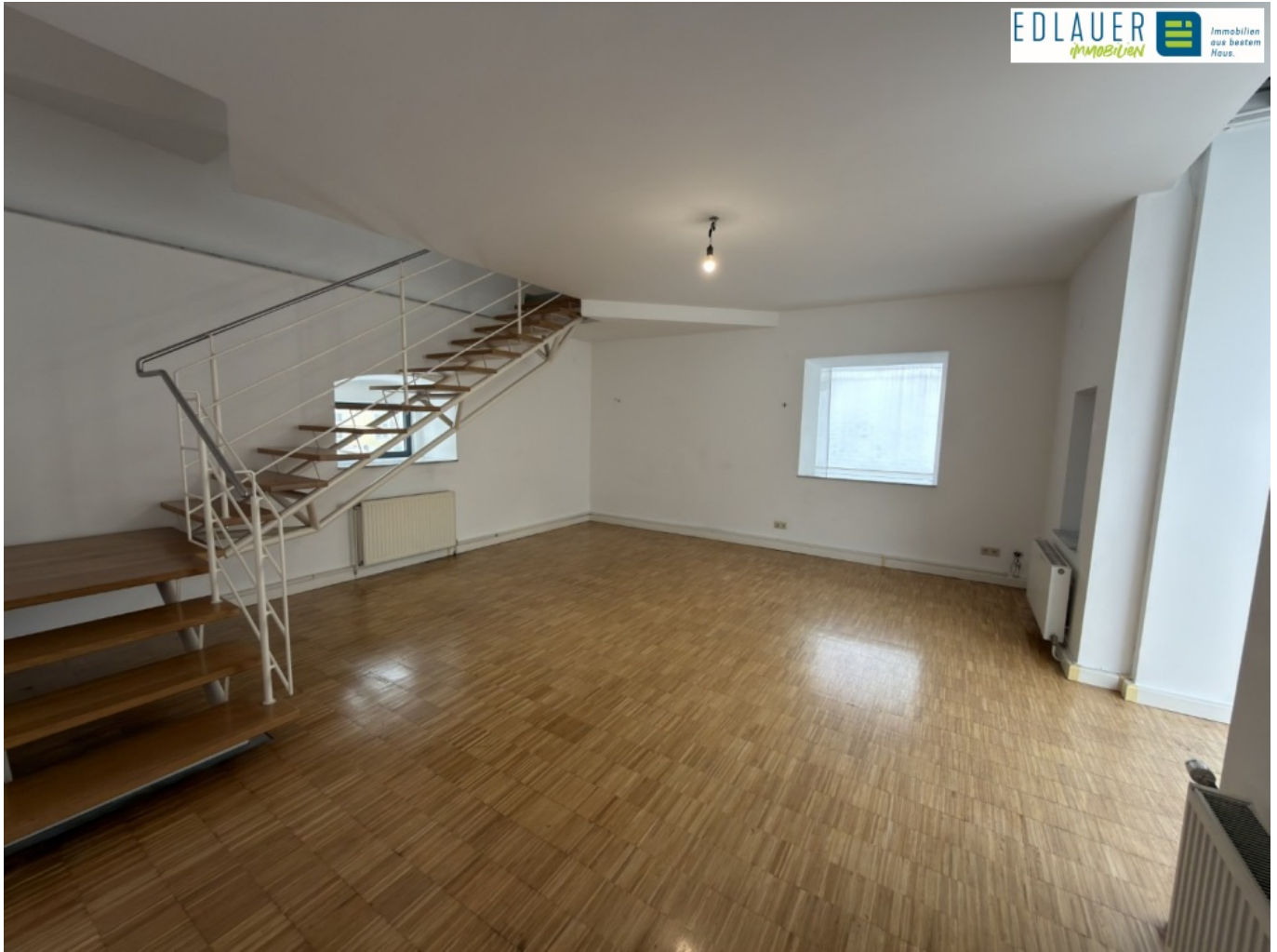
E1 Wohnzimmer (1)